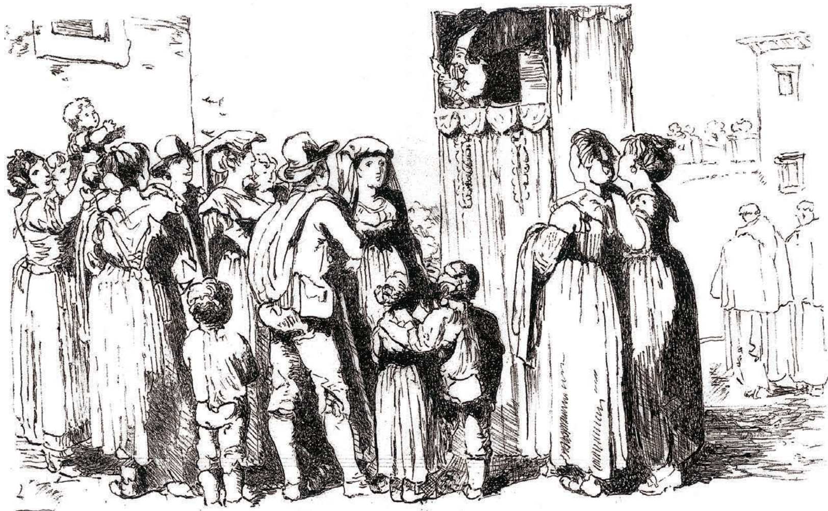
Il teatro dei burattini a Roma (Bartolomeo Pinelli, XIX secolo).